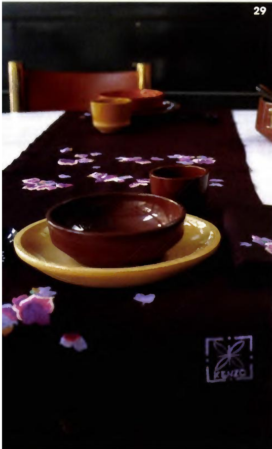
27 Linge de table Tuxedo Stripe en vinyle. Coloris : argent, doré, noir, beige, blanc. Prix : 26€. Chilewich. 28 Nappe ancienne framboise avec serviettes vieux rose et aubergine, monogramme. Château de Vaux. 29 Parure de table Audrey. Coloris chocolat et laque. Kenzo. 30 Chemin de table Malabar, 100% lin lavé. Couleurs : vision, pétrole. Prix : 36,50€. Lina Forlino.